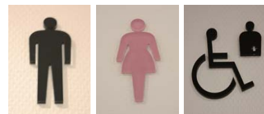
男性トイレサイン 女性トイレサイン 多目的トイレサイン