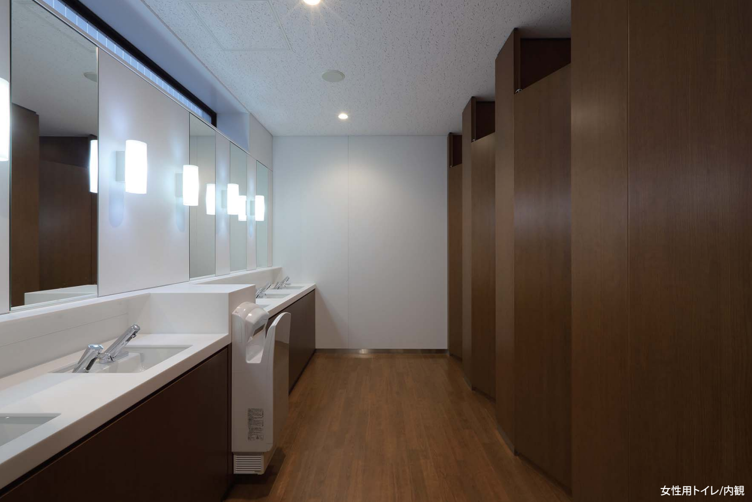
女性用トイレ/内観